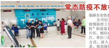
图为8月20日办公室、纪检监察部开展防疫联动检查

接到紧急任务后，公司高度重视，特事特办，当即组织管网维护公司前往施工接水，距离接到任务通知仅5小时便完成了外部敷设供水管道30米，具备了通水条件，保障疫情防控隔离点正常通水和后续的投入使用。（陆诚）