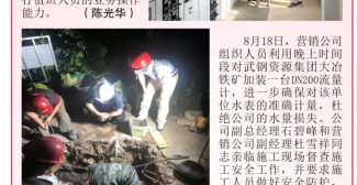
东方大道福安社区供水管道