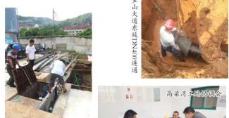
金山街道东岳社区供水管道