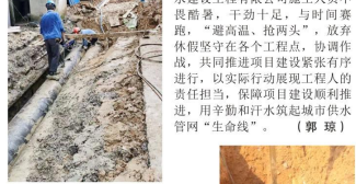
“三供一业”有色泵房管道施工

本报讯：夏季天气炎热，却是建设工程施工高峰期，市自来水有限公司施工人员不畏酷暑，干劲十足，与时间赛跑，“避高温、抢工期”，放弃午休坚守在各个工程点，协调工作进行，以实际行动展现工程人的责任担当，保障项目建设顺利推进，用辛勤和汗水筑起城市供水管网“生命线”。（郭琼）