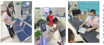
为落实好“三区”进出职工体温监测，值班室、食堂等区域环境消杀进行再监督再检查，严把疫情防控第一关。

三是积极向用户推荐微信公众号，网上办理各项业务，方便群众，得到了用户的一致好评。确保疫情防控和客户服务“两不误”。