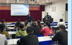
为提升营销公司职工营业水平, 规范营业标准, 提升职工对外服务能力, 11月5日下午, 营销公司组织开展营业水平提升培训...

黄石林村营营业推广知识、抄表流程、实际操作分析等方面的培训, 进一步营造了“比学赶超”的良好氛围, 全面提升营销人员的综合素质和专业技能。