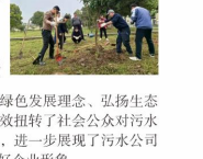
污水公司开展植树活动。

下一步，污水公司将持续深入践行“两山”理念，坚持生态优先、绿色发展导向，不断把生态文明建设与主业发展深度融合，以实际行动守护城市生态环境，为推动城市生态文明高质量发展贡献更大力量。（伊朝鹏）