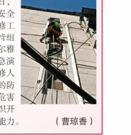
维修人员进行高空作业应急演练。

本报讯：3月6日，为提升维修人员高空作业安全意识及应急处置能力，保障维修工作安全有序开展，供水分公司特组织10余名维修人员在消防路美尔奈住宅楼开展外墙管道高空作业应急演练。通过演练进一步加强了维修人员对外墙管道维修高空坠落事故的防范，减少事故发生时的可能性和危害程度，及时、高效、有序地组织开展事故发生后的抢救救援处置能力。（曹琼香）